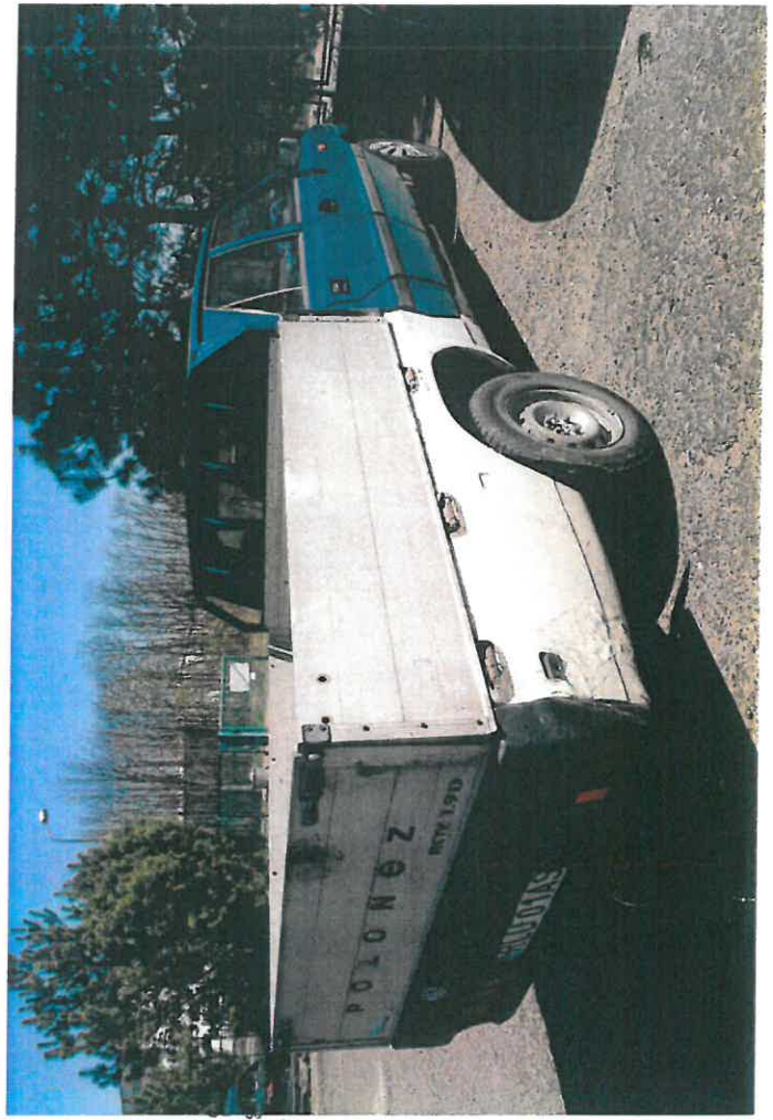
inż. Zdzisław CZOZNAWCA & upr. 0120