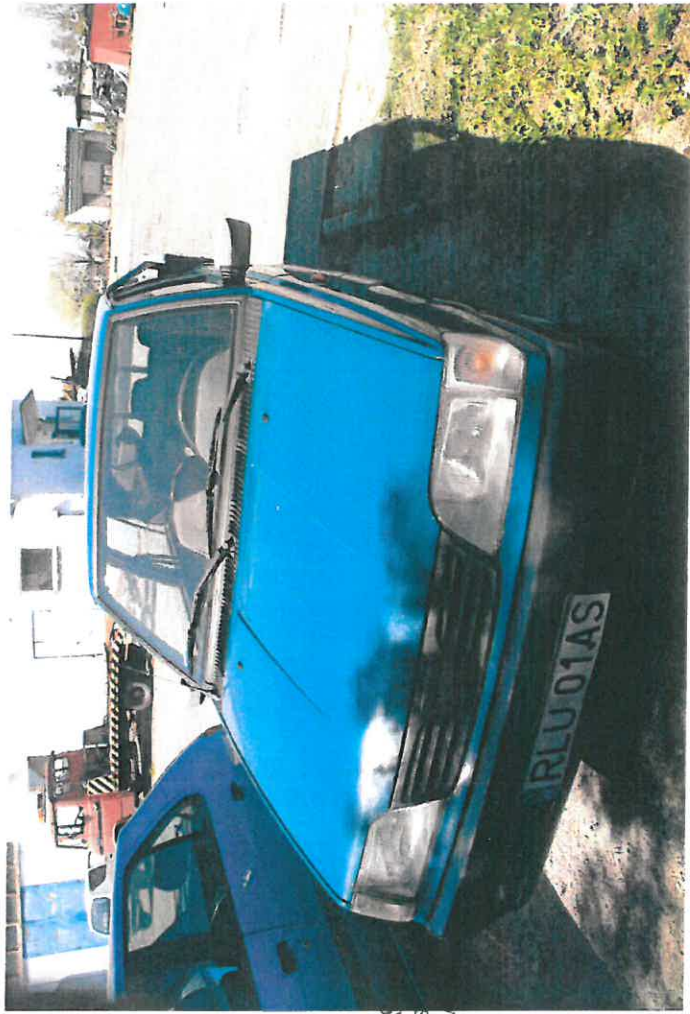
inż. Zdzisław CZOZNAWCA & upr. 0120